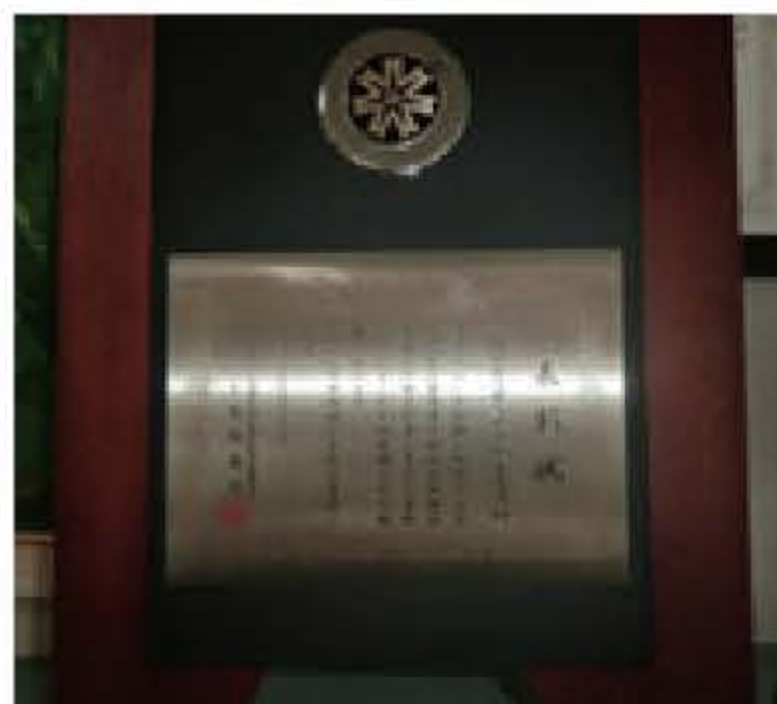
北海道危安協連の表彰楯