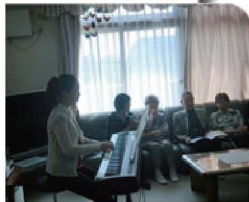
ピアノ演奏ボランティア