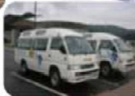
ε≡≡C (つ'V')つ バスハイク 少し遠くへ 出掛けます ε≡≡C (つ'V')つ

(*)V')人(V')*) (V')A')八(A')// (A')人(A')// 4'D' *||* D'P (D')人(D')