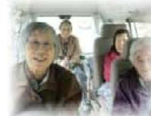
〰〰〰 (ΛωΛ) 〰〰〰