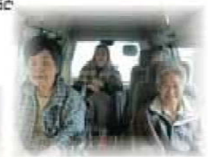
〰〰〰 (ΛωΛ) 〰〰〰