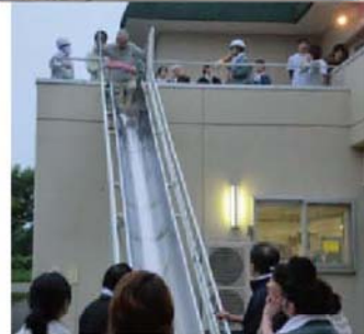
↓ 避難訓練 ↓