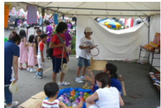
射的・輪投げ・ヨーヨー釣りのコーナーです