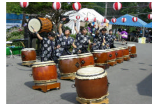
聖龍太鼓の皆さん、一糸乱れぬバチさばき！