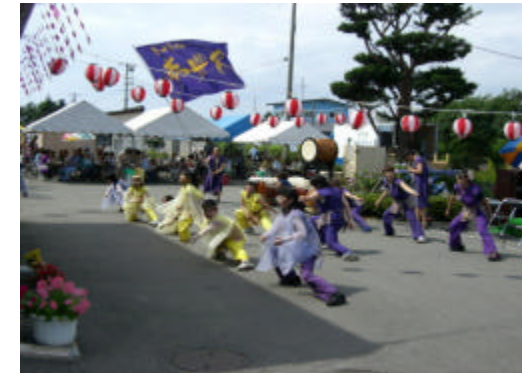
とよら夢豊民の皆さんのよさこいソーランです