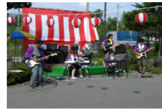
新しいメンバーが加わった楽団バンドです