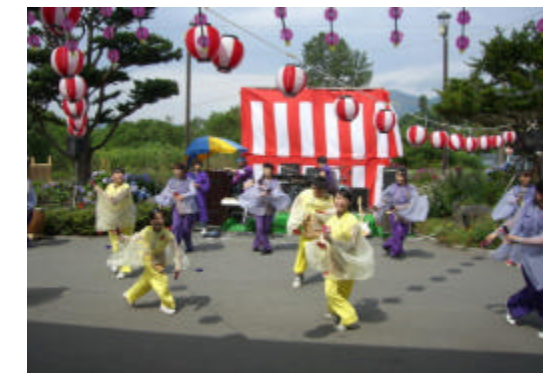
ハアーどっこいしょー、どっこいしょっ！