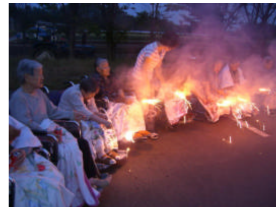
真夏の夜の花火大会の一コマです。

十月以降の主な行事予定 十月 衣類出張販売 十一月 文化祭 茶話会 十二月 クリスマス会 忘年会 一月 新年会 懇談会 二月 節分豆まき ひな壇飾り 三月 白鳥見学 彼岸法要