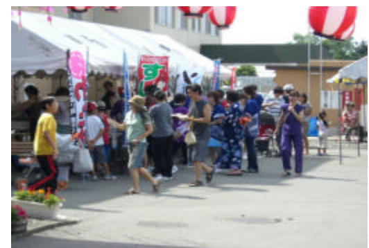
縁日コーナーも賑わってます。暑い日はやっぱりかき氷！