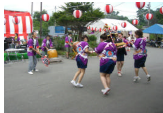
わっしょい！わっしょい！