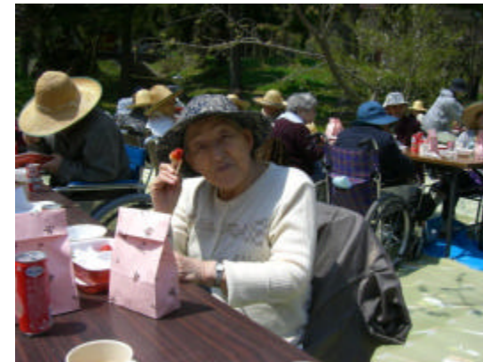
善光寺でお花見です。だけどやっぱり花よりだんご！