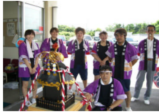
今年のお神輿の面々です。ファイトー！