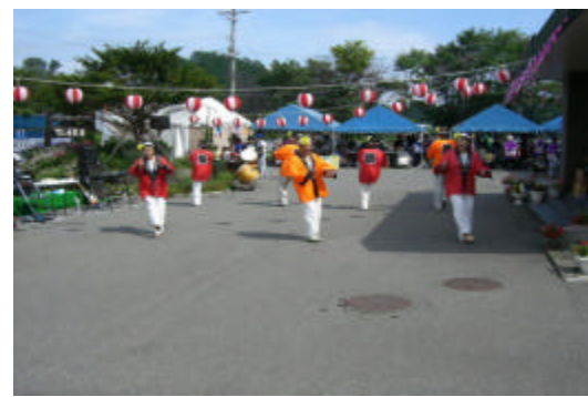
衣装を変えてまた踊っていただきました