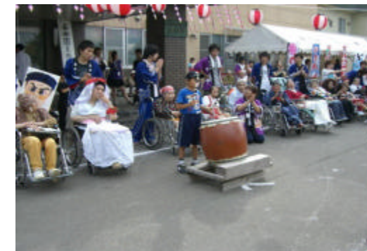
ずらり並んだ仮装の皆さん、結果発表を待ちます