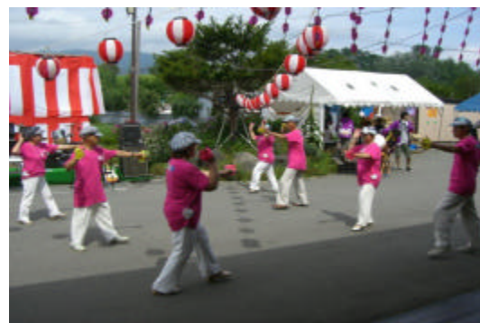
有珠ダンスサークルの皆さんです