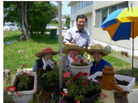
みんなでプランターに花を植えました