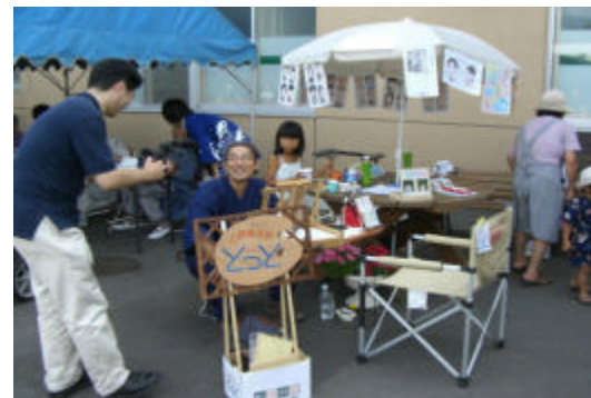
にがえやとっとさん、テレビの取材もきてました