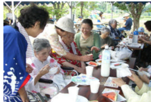
ご家族の皆さんと楽しいひとときです