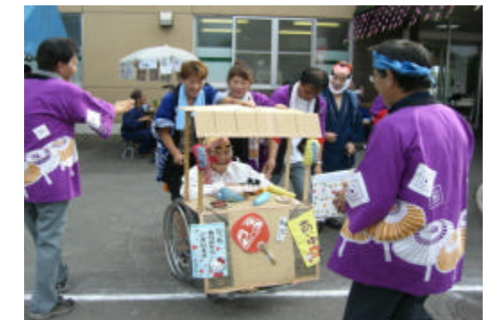
優勝したS様です、昨年準優勝の雪辱を果たしました！