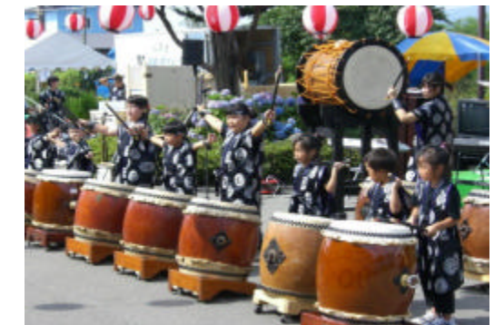
こちらはかわいい子供たちの演奏です