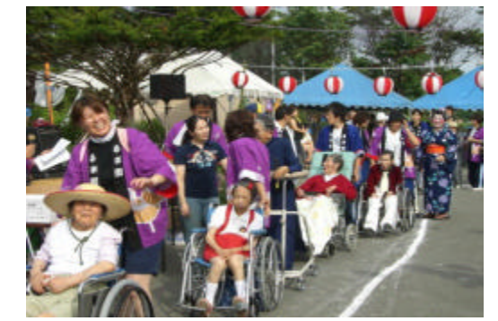
入園者の皆さんの仮装盆踊り大会です