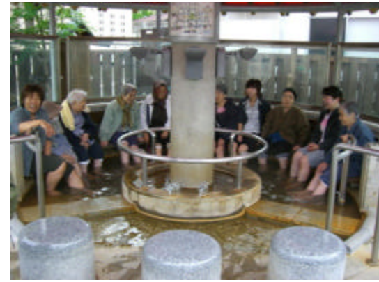
こちらは女性陣、別に男湯と女湯別れてるわけではありません！

「本年度の指針」 紅葉の季節になりました。喜楽園の指針としましては、ご利用者様の「安全」に配慮し、「安心」できる生活環境のなかでの「安定」した介護等ケアサービスの提供を心がけております。 「いのちの安」を基に職員一同、施設の使命として地域の皆様とともに一歩一歩前進できるよう努めます。